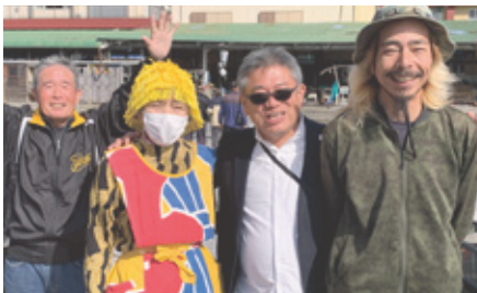
蒲江・西の浦にて