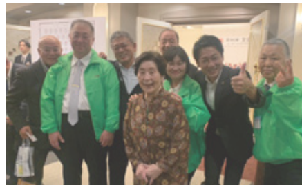
全国寿司組合大分大会