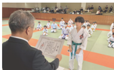
空手大会にて表彰