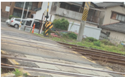
JR 生石踏切 応急復旧