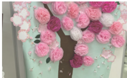
スタッフ制作の満開の桜