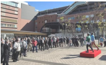
選挙戦 駅前でフィナーレ集会