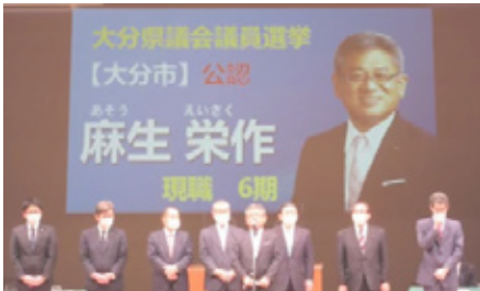
党大会での決意表明