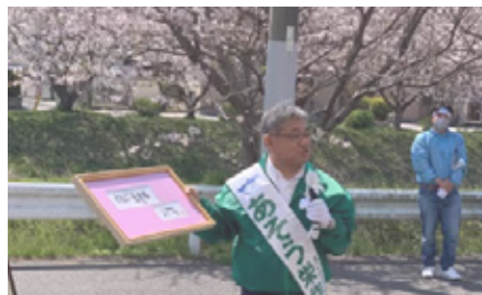
満開の桜の下で選挙活動