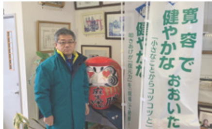
厳寒の街頭活動後