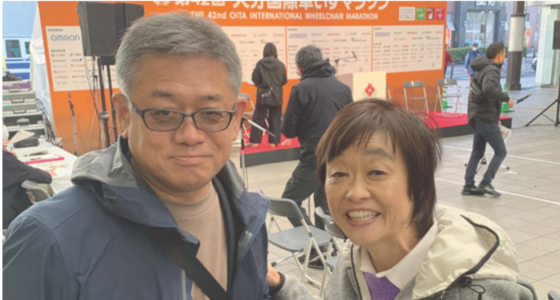
2023 国際車いすマラソン大会