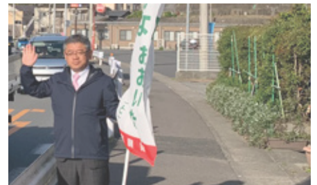
10回目となる当選翌朝の辻立ち

一年を振り返って 今年もお世話になりました。感謝です。 今年も穏やかに正月が幕を開け、春の統一地方選及び参議補選は新顔の登場で知事・市長・県議 会も刷新されました。 夏は、記録的猛暑が続き、災害も頻発したものの秋には、収穫・実りの季節を迎えました。 冬に入り、くらしや命に関わる対応を急がなければならぬ一方で、大型プロジェクト実現議論の地下作りも不可欠の時を迎えています。 県民にとっての『最後の砦』を守るオピニオンリーダーの役割を果たす覚悟です。数の力に奢ることなく、それこそが、最大会派自民党議員会長代行としての私の使命と自覚し、取り組んで参ります。